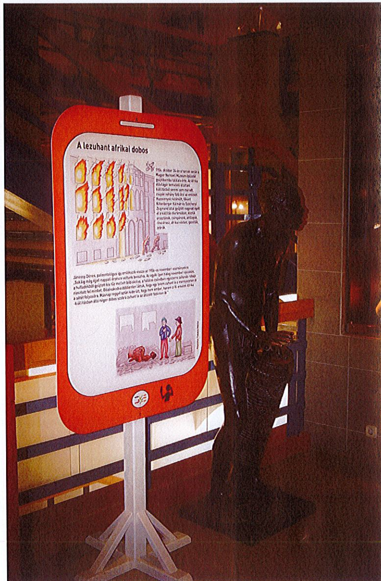
Az egyik kiemelt tárgy az új információs táblával