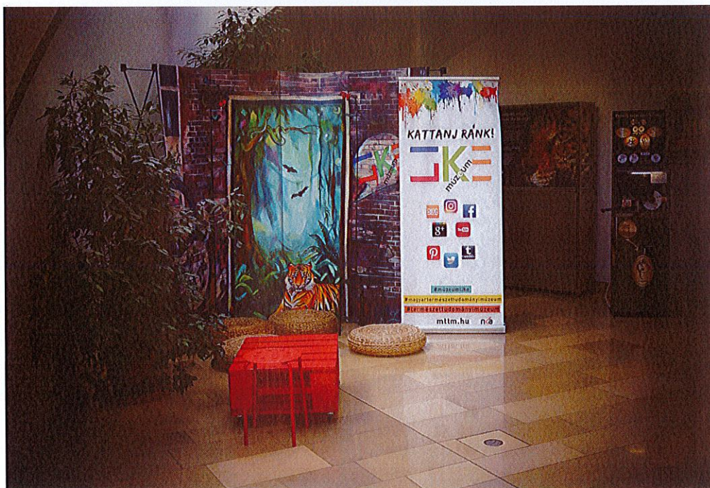
A mobil installáció a múzeum fogadócsarnokában