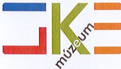
A program logója