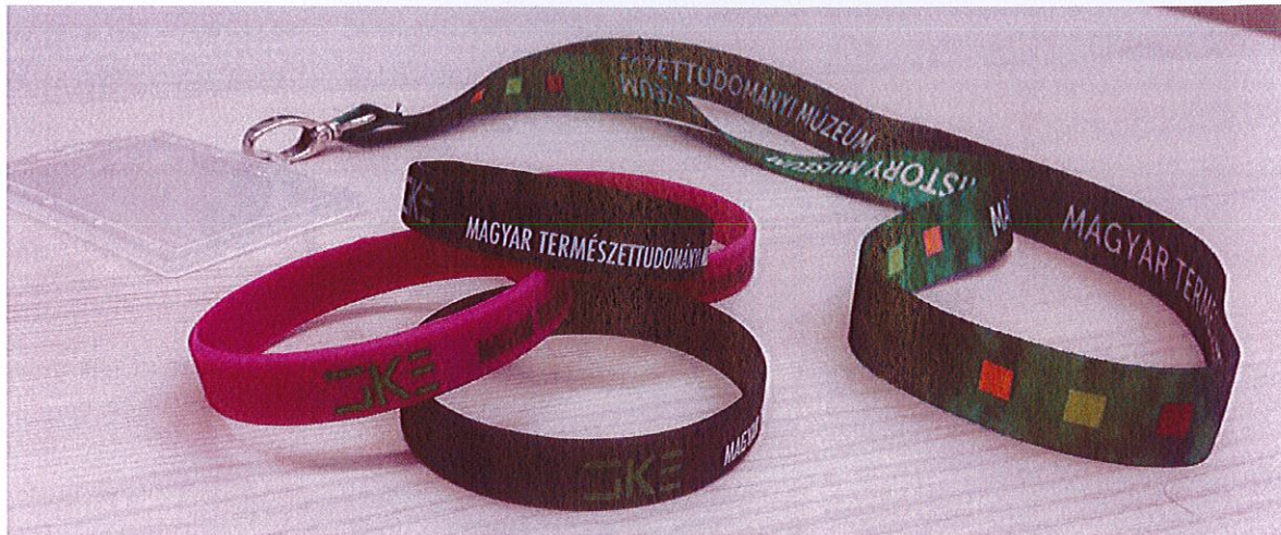
Az arculatmegújítási programot reklámozó promóciósajándékok, és az egységes belső arculathoz hozzájáruló nyakpántok

Az arculatmegújítás keretében megvalósított program további működtetése során első lépésként intenzív facebook-kampányt valósítunk meg a program népszerűsítésére, az alkalmazott arculati elemeket pedig a jövőben a fiataloknak szóló programokban, információs anyagokban alkalmazzuk és bővítjük.