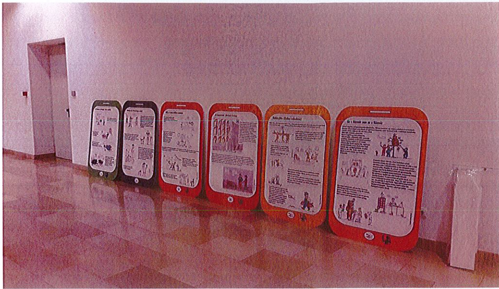
kiemelt tárgyakhoz kapcsolódó új információs táblák installálás előtt