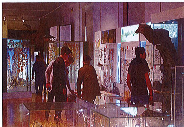
Az első filmklub résztvevői a kiállásban