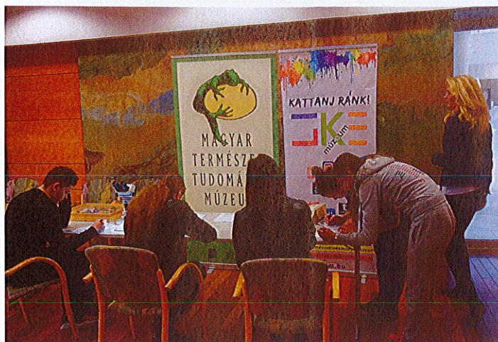
Az első filmklub résztvevői a szelfi-túrához kapcsolódó feladatlapok megoldása közben