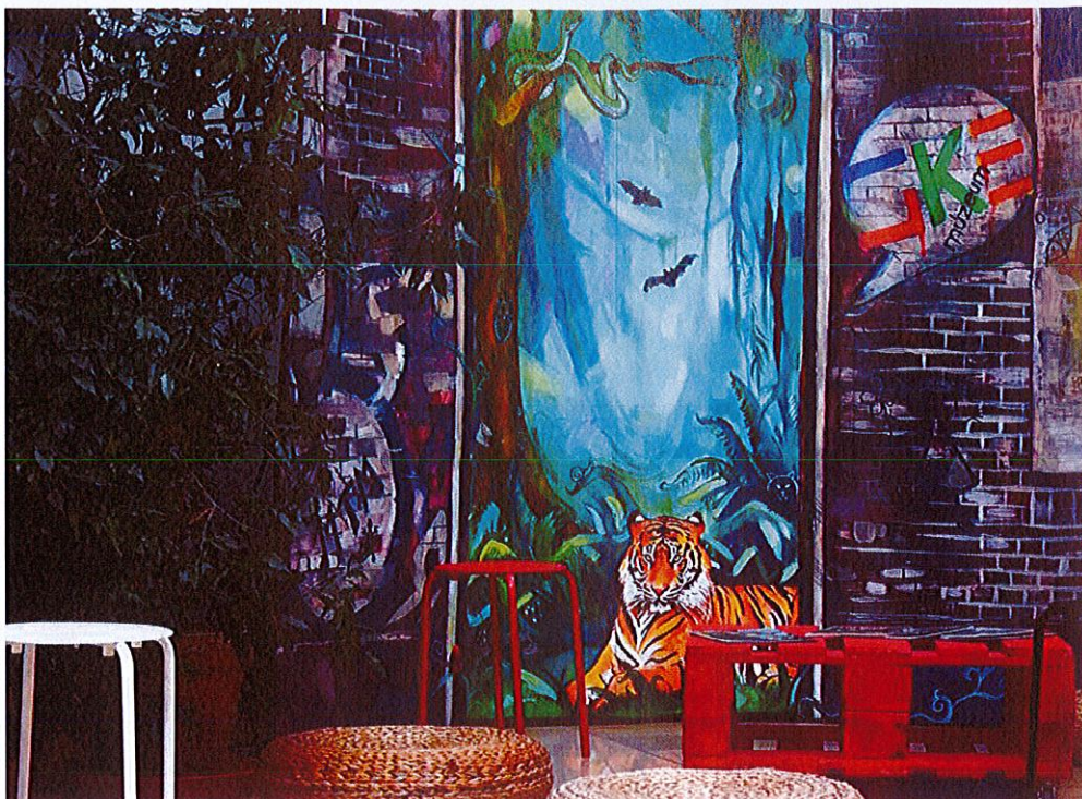
A mobil installáció a múzeum fogadócsarnokában