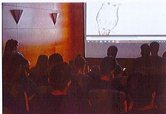
Az első filmklub hátrányos helyzetű fiatal résztvevői