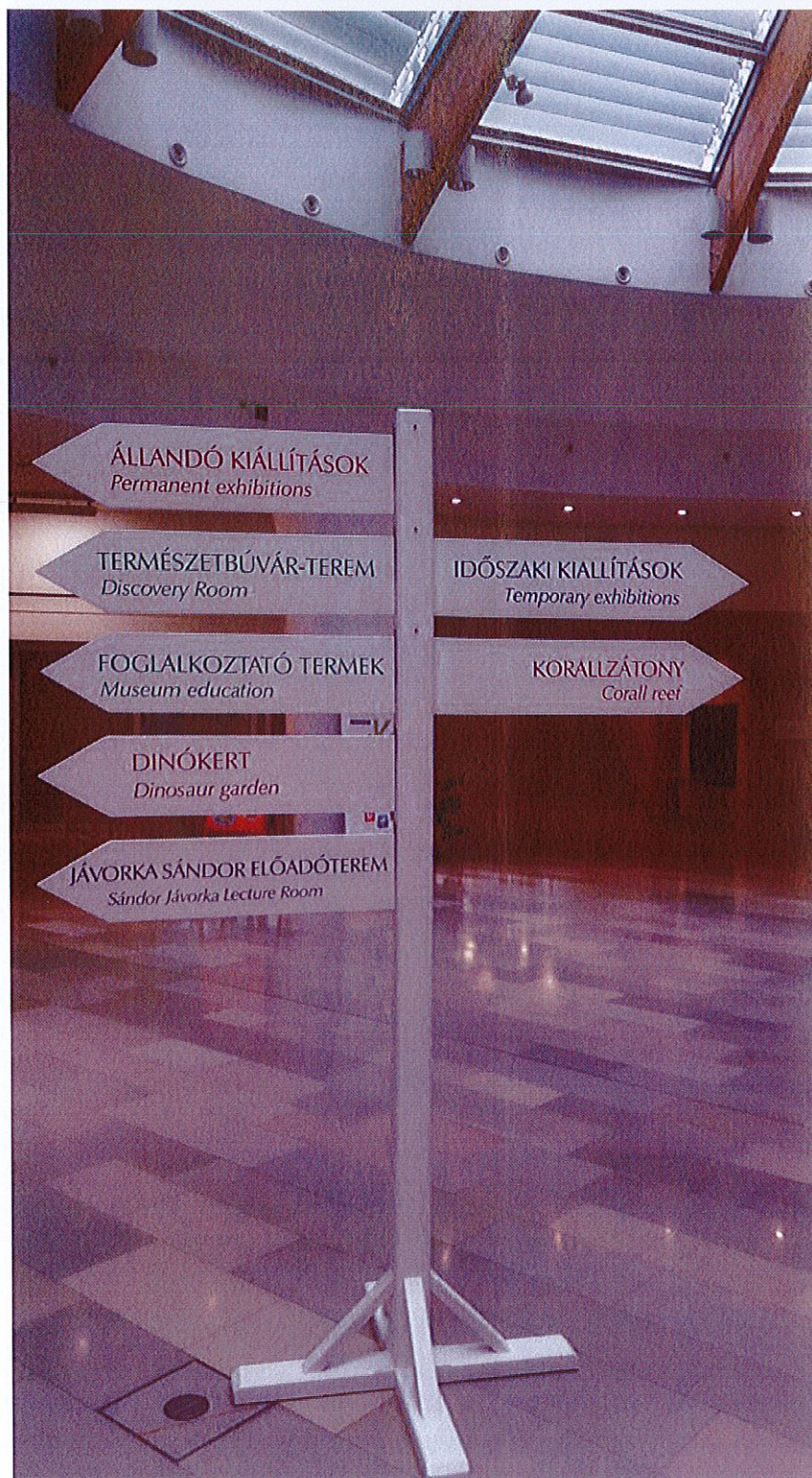
Irányítóegység a múzeum közönségforgalmi terében